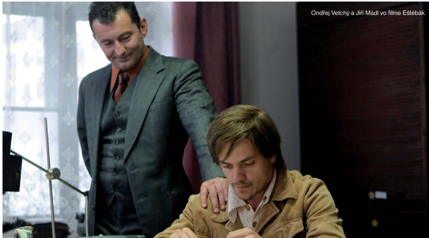
Ondřej Vetchý a Jiří Mádrl vo filme Eštabák

útokov na prívržencov Marxizmu a Leninizmu. Nudné, prázdne tliachanie o králikárňach, v ktorých žijú tieto obeť doteraz (a radi) a priam srdcervúce posolstvá o boji za slobodu však znejú z úst týchto pseudotitanov ako verše z kánonu. Tú slobodu, obeťou ktorej sme sa stali práve my, tí, čo vedia rozoznať skutočné Zlo od Dobra a Správne od Nesprávneho.