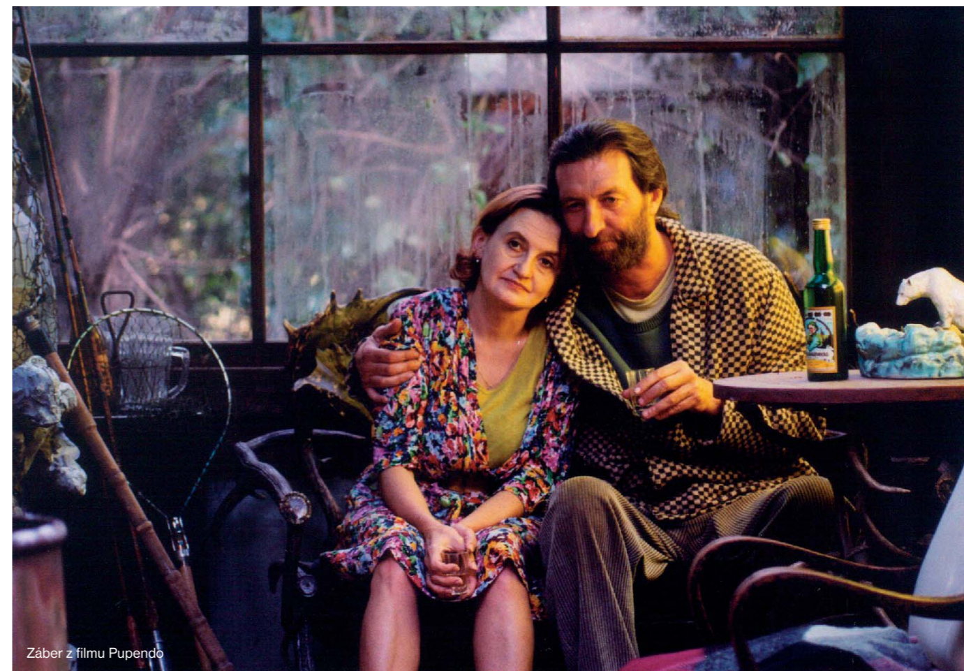
Záber z filmu Pupendo

Všade sa zmietať v šokujúcich obraťoch bezvercov na vieru a paradoxne bezbožných a nemravných verbálnych